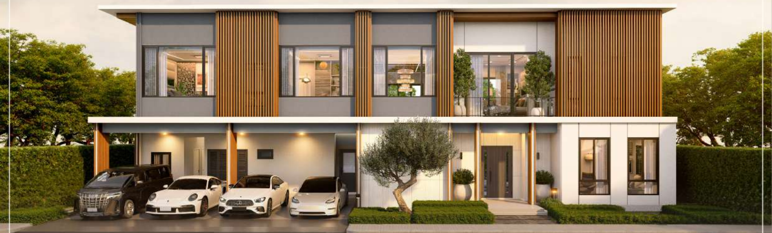
ภาพและบรรยากาศจำลอง