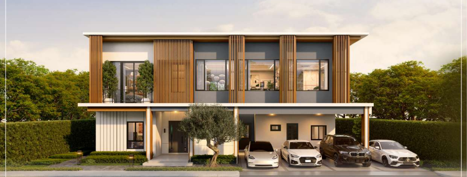
ภาพและบรรยากาศจำลอง

LAND AREA : 107-131 SQ.W USABLE AREA : 423 SQ.M. พร้อม AQUA MASSAGE POOL